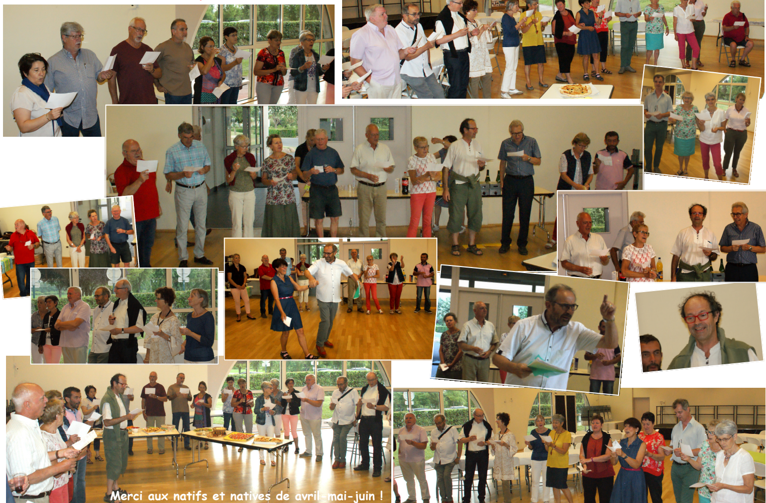
Merci aux natifs et natives de avril-mai-juin !