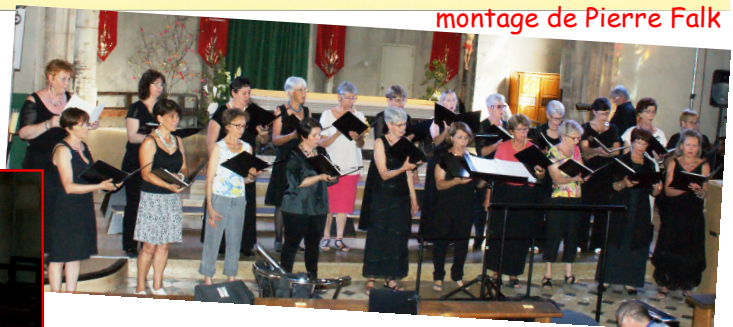
montage de Pierre Falk