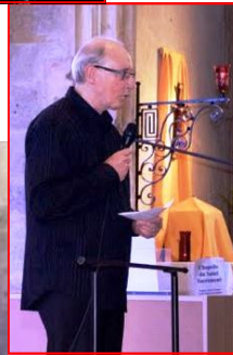
des Ans Chanteurs