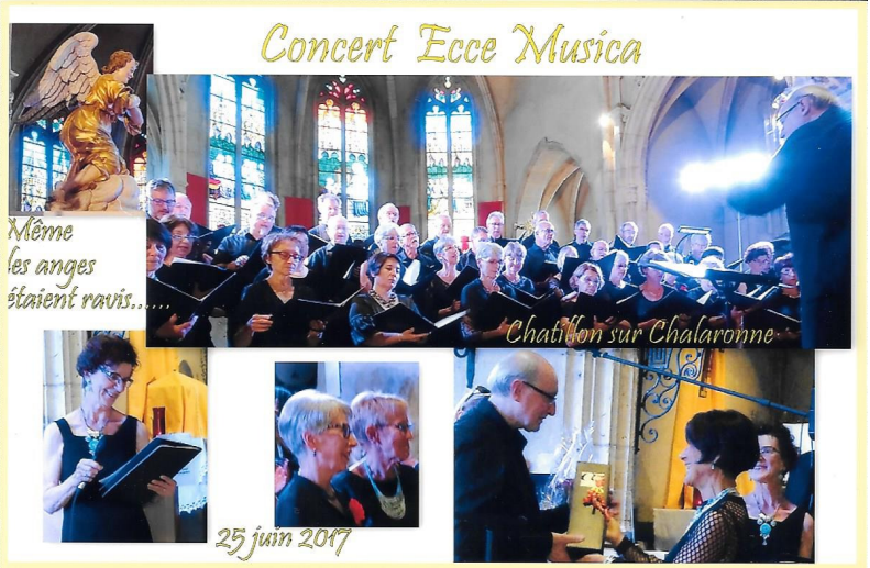
Concert Ecce Musica