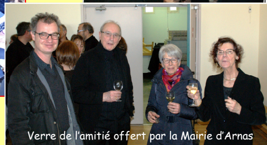
Verre de l'amitié offert par la Mairie d'Arnas