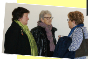
3 chorales beaujolaises...