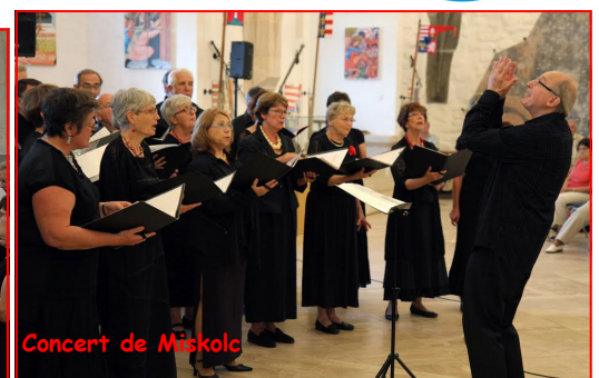
Concert de Miskolc