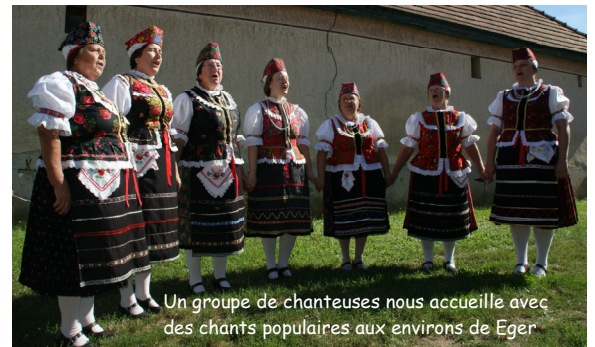
Un groupe de chanteuses nous accueille avec des chants populaires aux environs de Eger