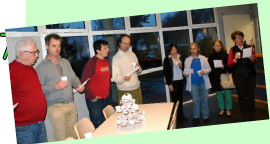
Nos divas divines