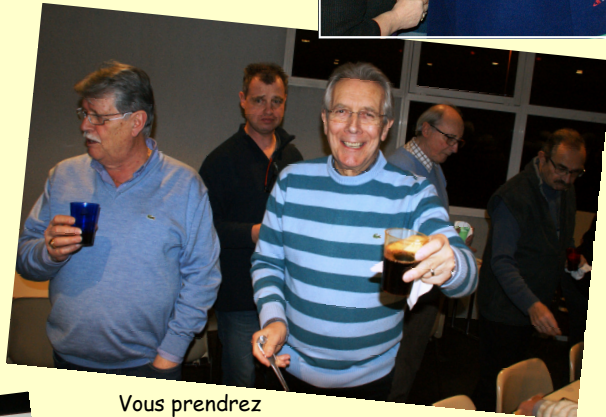
Vous prendrez bien quelque chose !...