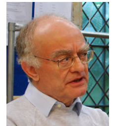
John Rutter 2012

Il a également écrit des œuvres profanes, notamment des opéras pour enfants et des pièces pour orchestre.