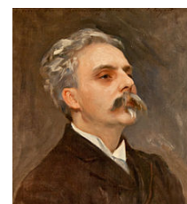
Fauré en 1889

Gabriel Fauré dédia son Madrigal à son ami André Messager à l'occasion de son mariage en 1883. Sur des vers d'Armand Silvestre (romancier et poète français 1838-1901), le Madrigal fut ensuite donné en concert dans sa version avec piano le 12 janvier 1884 par le Chœur de la Société Nationale de Musique. Fauré dirigea lui-même la première exécution de la version avec orchestre le 30 avril 1894. Vladimir Jankélévitch a relevé qu'il y avait quelque chose de la précieuse ingénuité des Fêtes galantes de Verlaine dans cette œuvre dont le thème initial est inspiré du sujet de l'admirable fugue en mi bémol mineur du premier livre du Clavier bien tempéré de Bach, enrichi par une écriture pleine de souplesse et d'élégance.