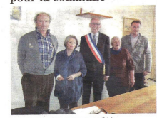
Le nouveau maire et les quatre adjoints adjoints.