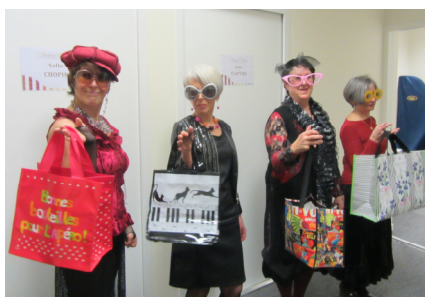
Femmes à lunettes ...

(Refrain 2:) Ne vous mariez pas, les filles, ne vous mariez pas Mettez vos robes de gala Allez danser à l'Olympia Changez d'amant quat' fois par mois Prenez la braise et gardez-la Cachez la fraîche sous vos matelas A cinquante ans, ça servira A vous payer des beaux p'tits gars Rien dans la tête, tout dans les bras Ah, la belle vie que ça sera Si vous n'vous mariez pas, les filles Si vous n'vous mariez pas.