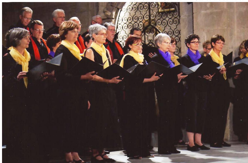
Te Deum de Gounod à la Cathédrale de Vaison