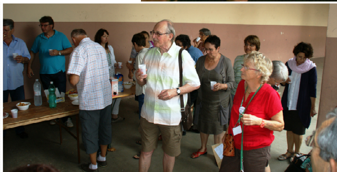
Pot de l'amitié après la Générale du 7 août 2013