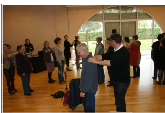
petite mise en voix solennelle!..