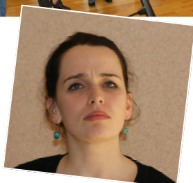
Il y a comme un bémol !! (de trop)...